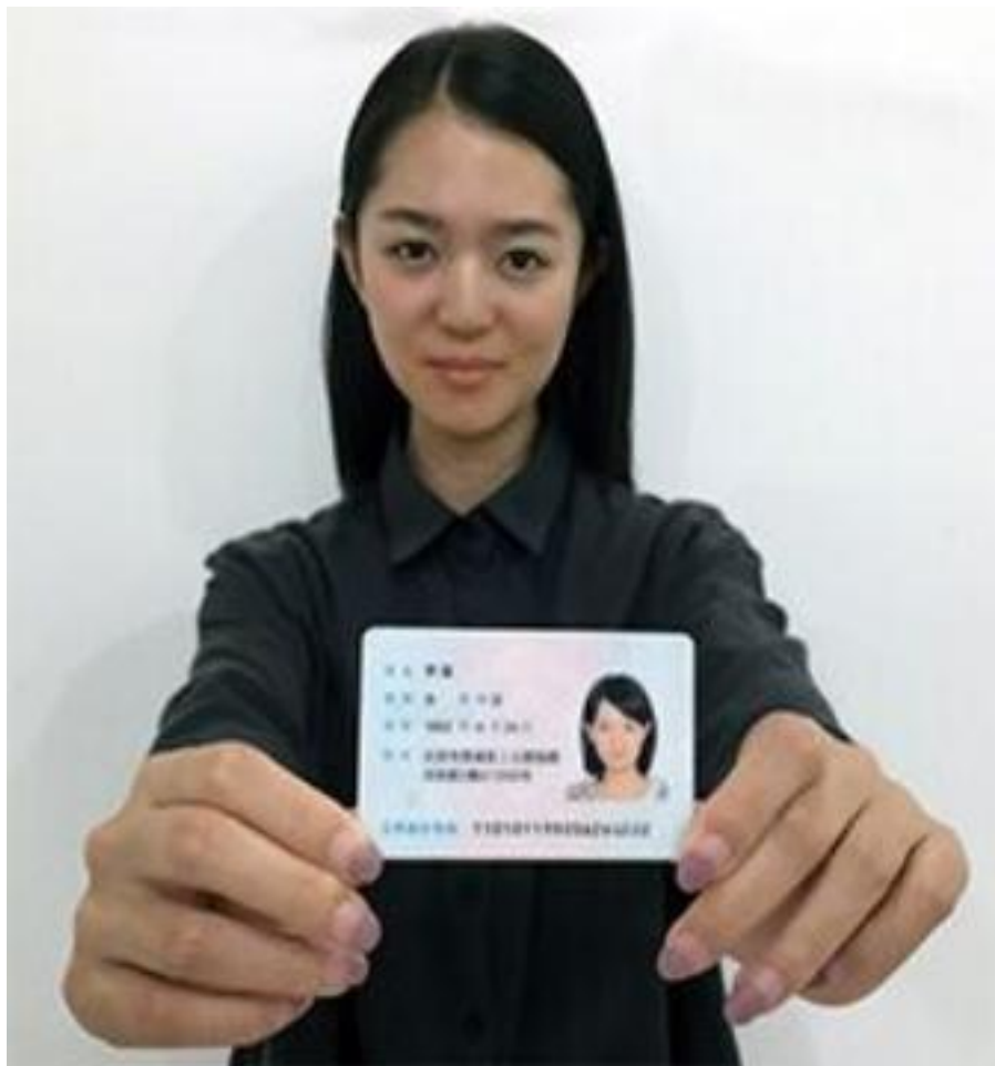
手持身份证照片示例