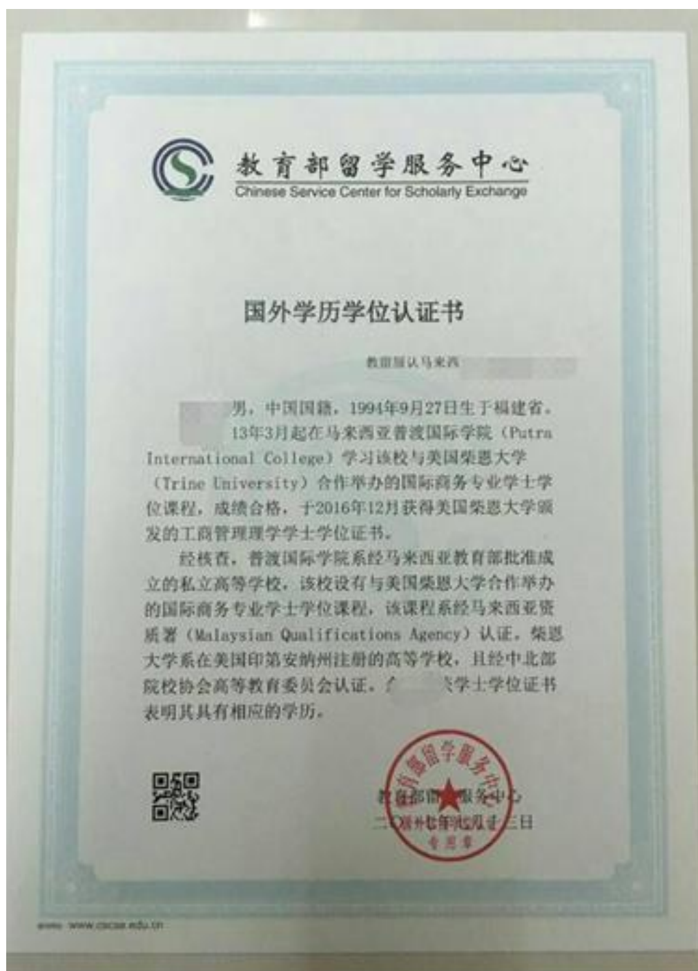
教育部留学服务中心出具的认证报告照片示例