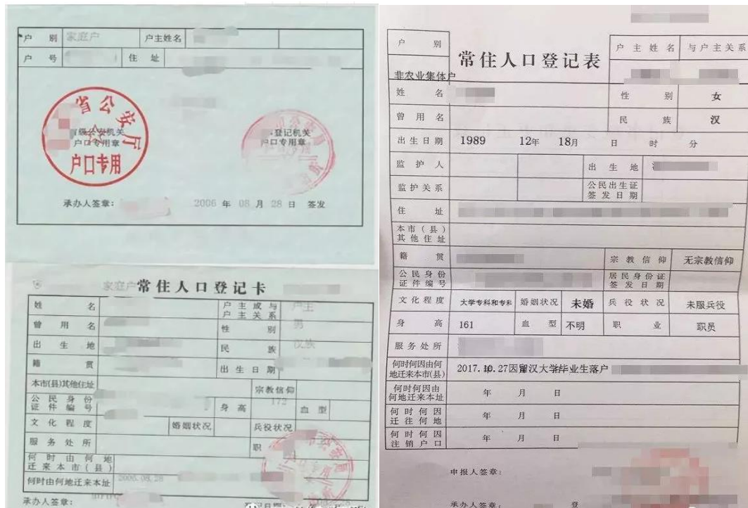
户口本与常住人口登表示例