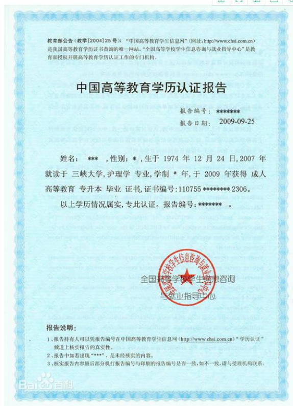
教育部学历认证报告照片示例